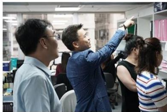
参观中汇安达办公室