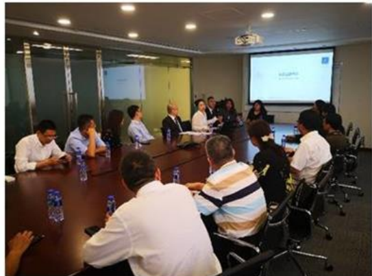
云峰金融介绍其投融资平台