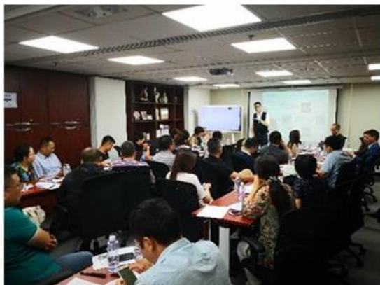
中汇安达CRS课题交流