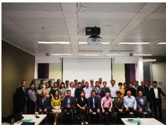
和香港税务学会合影