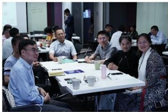
学员聚精会神听课